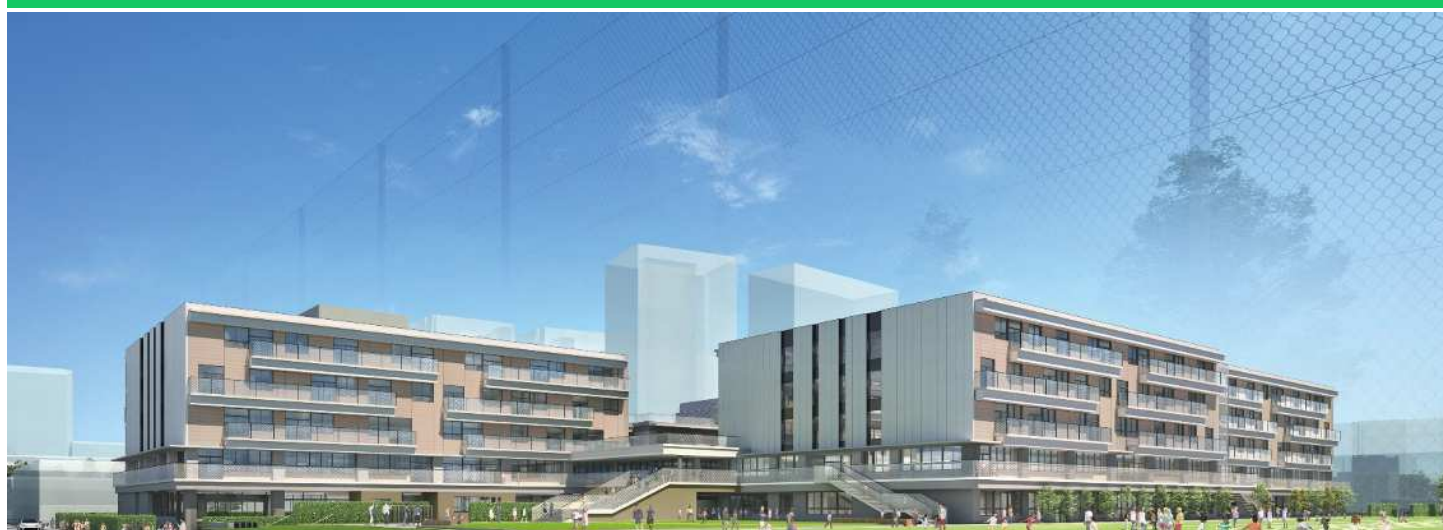
※沼影新校舎のイメージ図